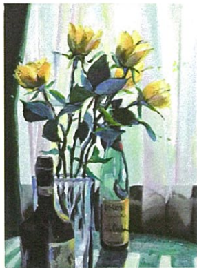
「黄色いバラのある静物」 33.3×45.5cm