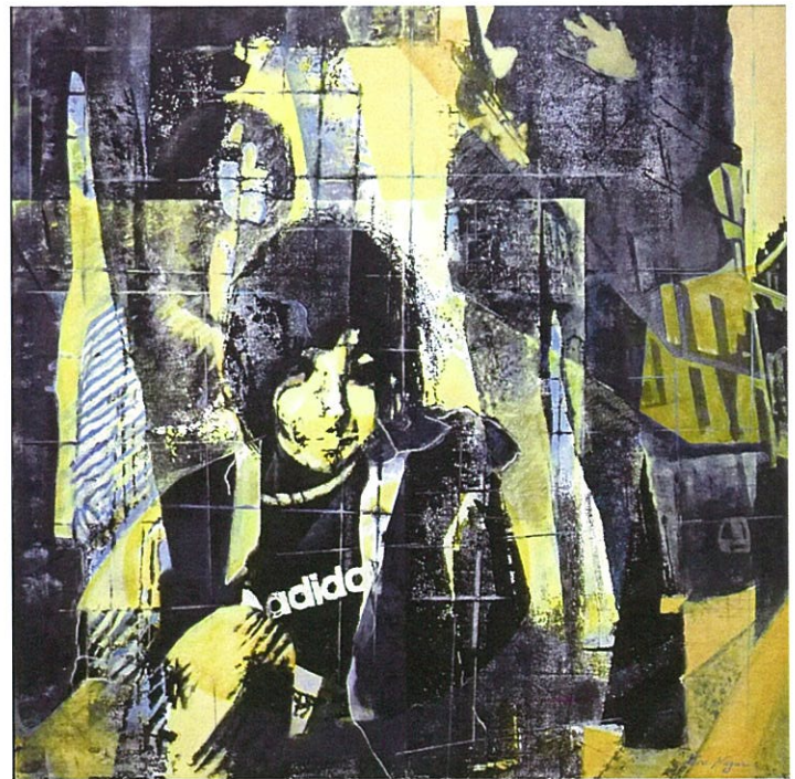
「街角にて」162 x 162cm、2012 年上野の森大賞展参加作品