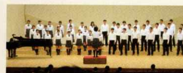
12月 合唱コンクール(1・2年)