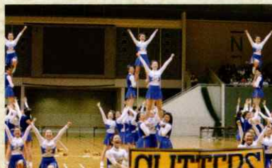
チアリーディング部