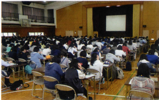
1年生 セミナー合宿

三年間部活動に所属したため、1、2年次は十分な勉強量はこなせませんでした。授業は真面目に聴きました。 (2016年3月卒業 東京大学現役合格)