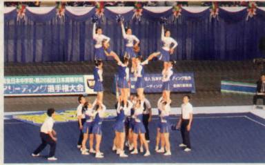
チアリーディング部