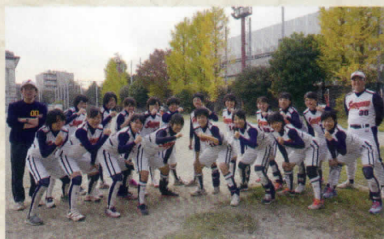
女子ソフトボール部